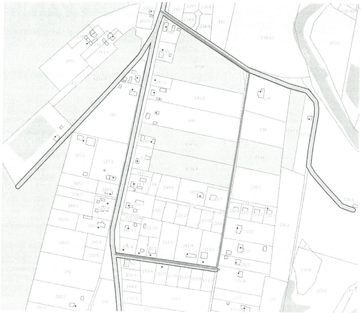
Załącznik nr 1