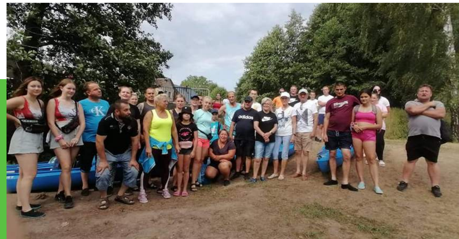
"Poznajemy krajobraz Gminy Szydłowo" Kwota dotacji: 500zł Całkowity koszt zadania: 1500zł