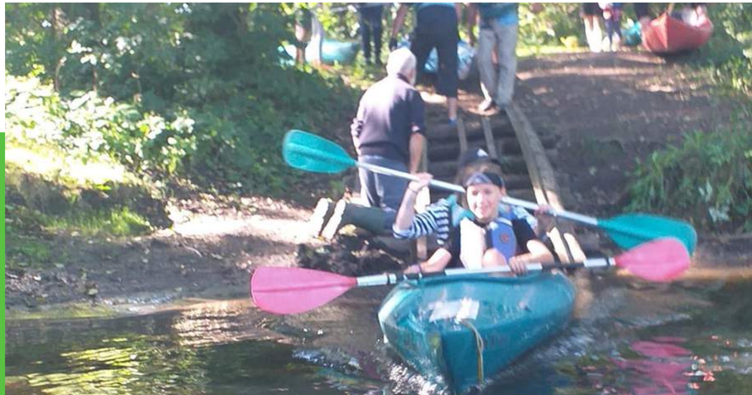
"Rodzinne Kajaki i Stylowa Biesiada Szydłowian" Kwota dotacji: 500zł Całkowity koszt zadania: 2224,59zł