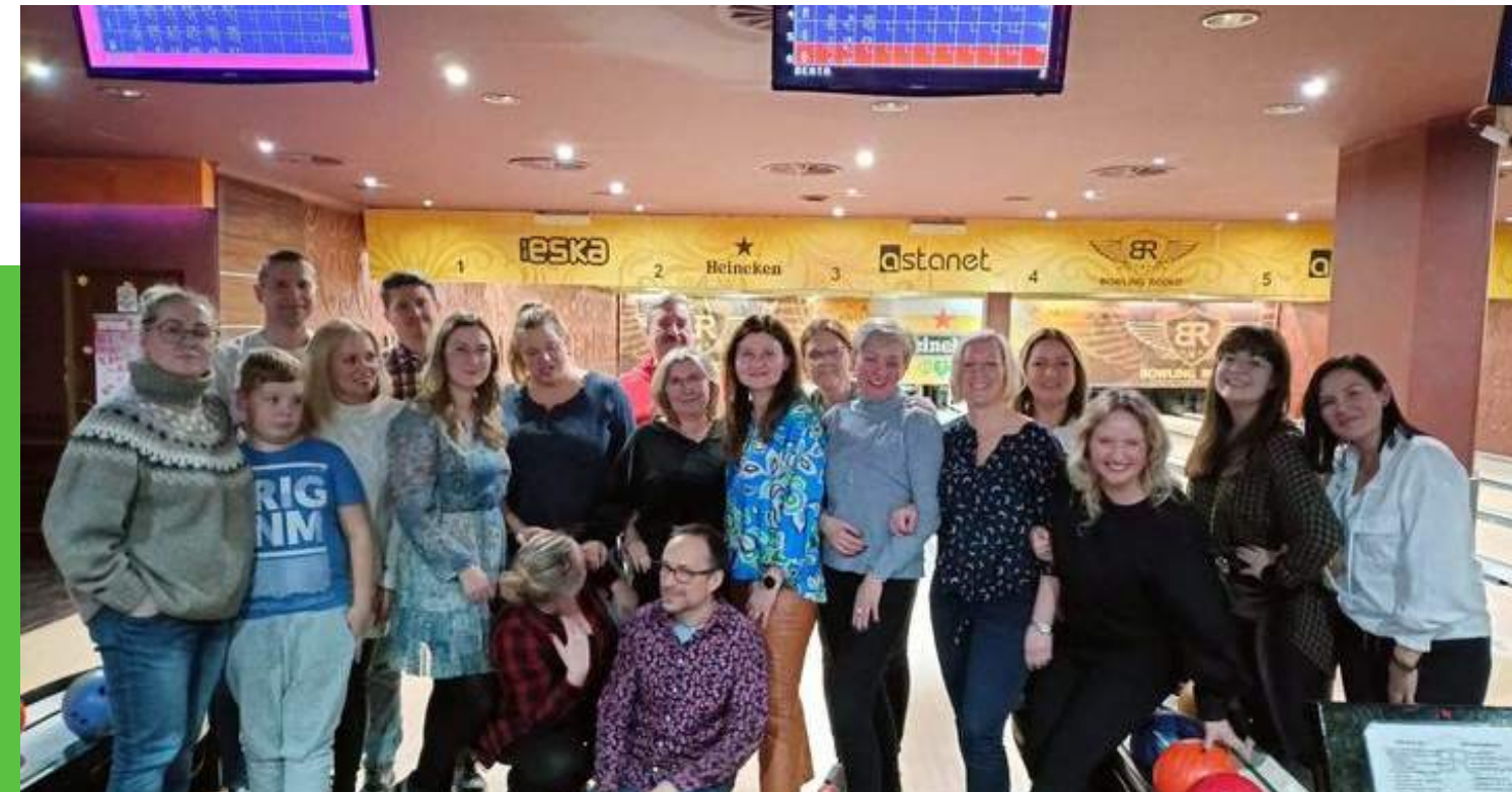
"Bowlingowy turniej sportowy" Kwota dotacji: 500zł Całkowity koszt zadania: 500zł