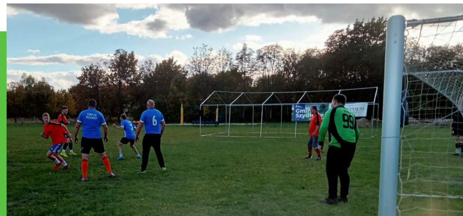
"Przyjazny sport przyjazny dla zdrowia" - w ramach zadania odbył się mecz Żonaci Kontra Kawalerowie Kwota dotacji: 1000 zł Całkowity koszt zadania: 2429,64 zł