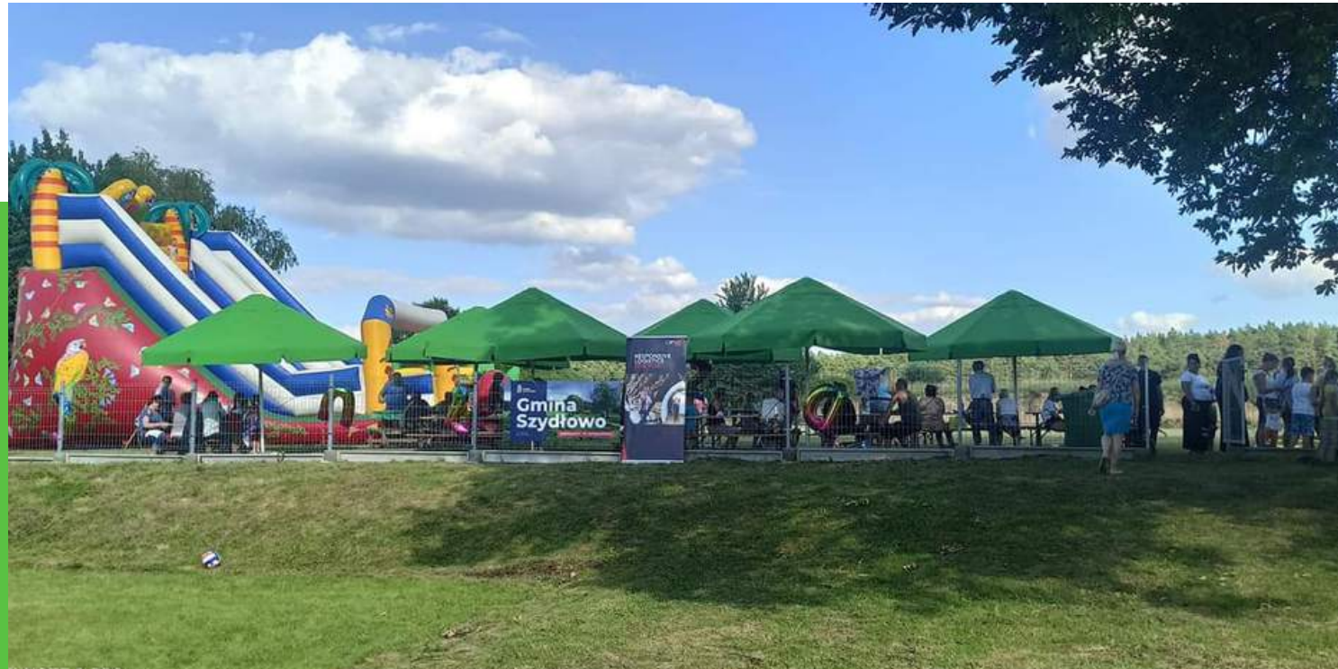
"Dzień Dziecka na sportowo w Zawadzie" Kwota dotacji: 1500zł Całkowity koszt zadania: 3440zł