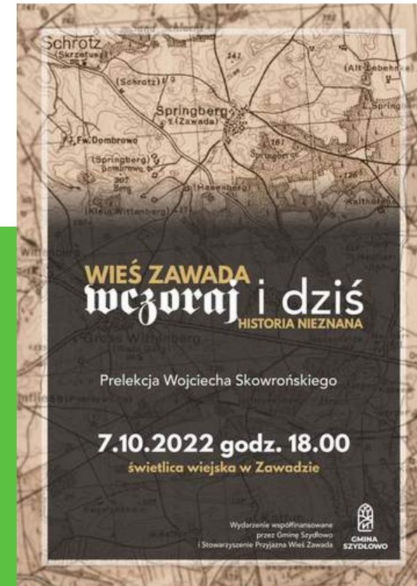
Wieś Zawada "Wczoraj i dzisiaj historia nieznaną" Kwota dotacji: 1300zł Całkowity koszt zadania: 1290,60zł