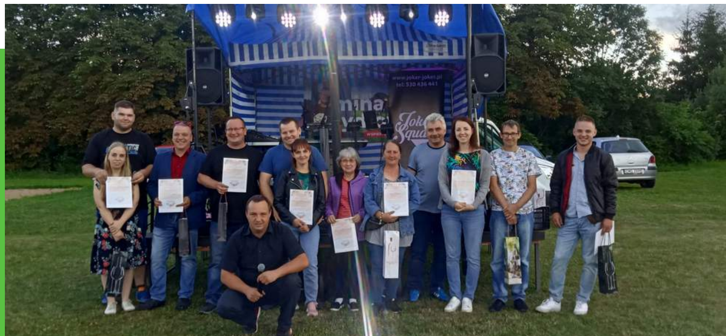
"Impreza kulturalna z cyklu Dni Nowego Dworu" Kwota dotacji: 4000 zł Całkowity koszt zadania: 6271,85 zł