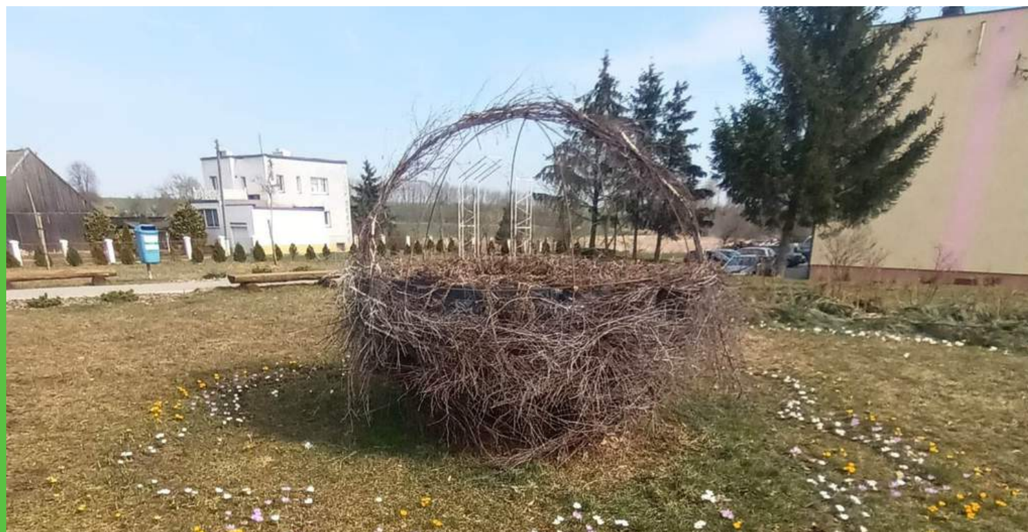
"Dywan z Krokusów" Kwota dotacji: 1500zł Całkowity koszt zadania: 1832,50zł