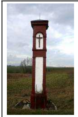
Kapliczka w miejscowości Leżenica przy drodze Leżenica – Szydłowo