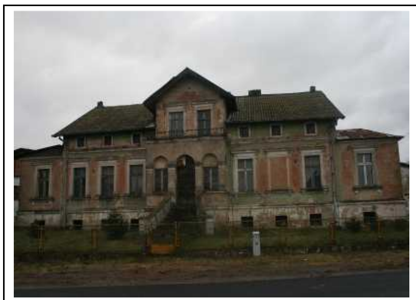
Zespół dworsko- folwarczny w Jaraczewie

Kościół p.w. św. Jakuba Apostoła w Leżenicy wpisany do rejestru zabytków w 2006 r. pod nr 426/Wlkp/A. Zbudowany dla tutejszych katolików w latach 1854-55. Świątynia ceglana, jednonawowa, z węższym prezbiterium zamkniętym trójbocznie, z przylegającą od strony północnej zachrystią. Nad nawą dach dwuspadowy, nad prezbiterium pięciospadowy. Wnętrze jednonawowe nakryte stropem drewnianym, otynkowanym, w prezbiterium sklepienie krzyżowe. Budowla wzniesiona w stylu neogotyckim z schodkowym szczytem z ostrołukowymi blendami i figurą św. Jakuba Apostoła w elewacji zachodniej.