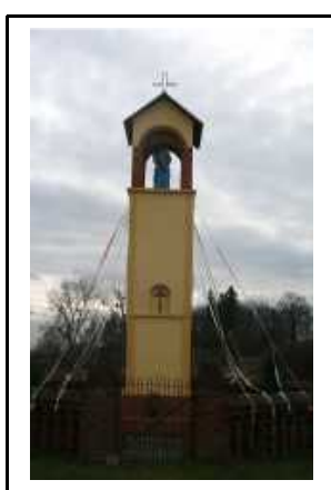
Kapliczka Matki Boskiej z Dzieciątkiem w Róży Wielkiej (droga Trzcianka – Wałcz)