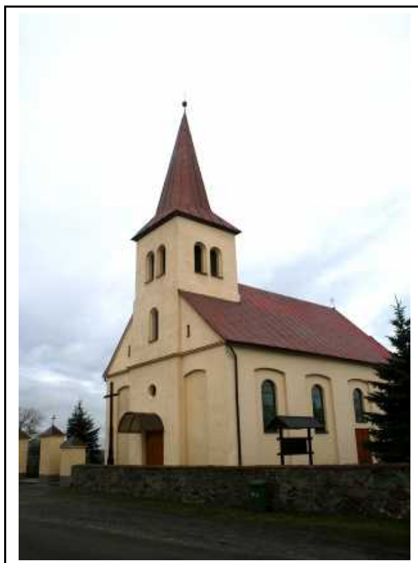
Kościół parafialny p.w. Trójcy Św. w Róży Wielkiej

Kościół parafialny p.w. św. Trójcy w Róży Wielkiej wpisany do rejestru pod nr 90/Wlkp/A. W obecnej neoromańskiej formie wybudowany w roku 1830. W roku 2002 rozpoczęto prace remontowe obejmujące wymianę zawilgoconych tynków i malowanie wnętrza, remont elewacji frontowej oraz malowanie dachu wieży.