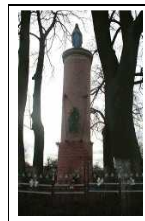
Kapliczka Matki Boskiej w miejscowości Leżenica