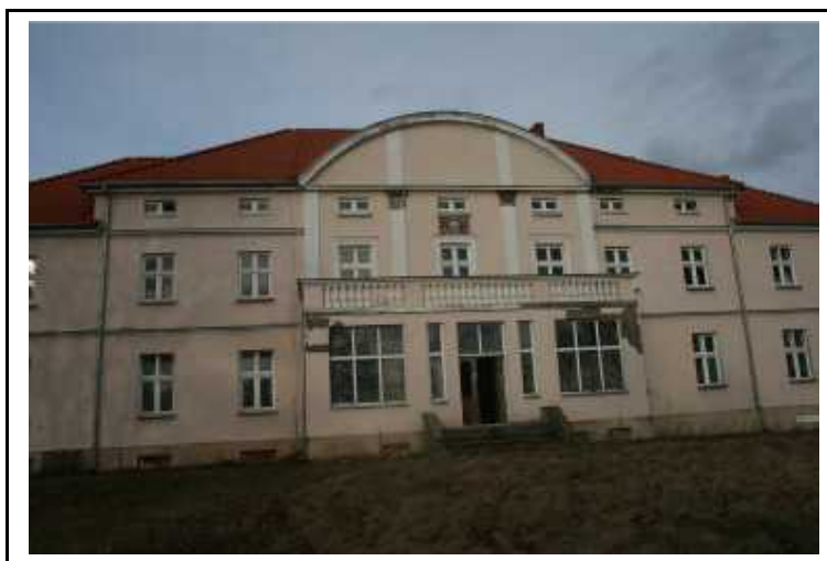
Zespół pałacowo - parkowo- folwarczny w Kotuniu

Obiekt wpisany do rejestru zabytków pod nr A-589 zbudowany na początku XX w., w stylu modernistycznym. Usytuowany na wzniesieniu w miejscowości Kotuń. Dwukondygnacyjny, murowany z cegły, całkowicie podpiwniczony. Obecnie jest własnością prywatną. Przed sprzedażą obiektu Agencja Własności Rolnej Skarbu Państwa OT w Pile w 1999 r. przeprowadziła remont elewacji, wymieniła stolarkę okienną oraz pokrycie dachowe z eternitu na dachówkę ceramiczną. Potrzebne są prace remontowe na zewnątrz i we wnętrzu obiektu.