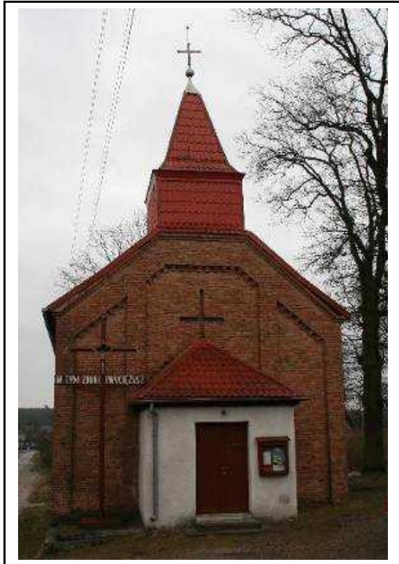
Kościół filialny p.w. MB Częstochowskiej w Krensku

Obiekt wpisany do rejestru zabytków pod nr A-21/349. Niewielki, jednonawowy, z nawą pokrytą drewnianym stropem. Obecny kościół zbudowany został w 1845 r., pierwotnie konstrukcji szachulcowej, przebudowany w 1935 roku. W początkach lat 70- tych XX w. ściany szachulcowe zamieniono na murowane z cegły. Pierwotnie kościół wyznania ewangelickiego, po roku 1945 – rzymsko-katolicki.