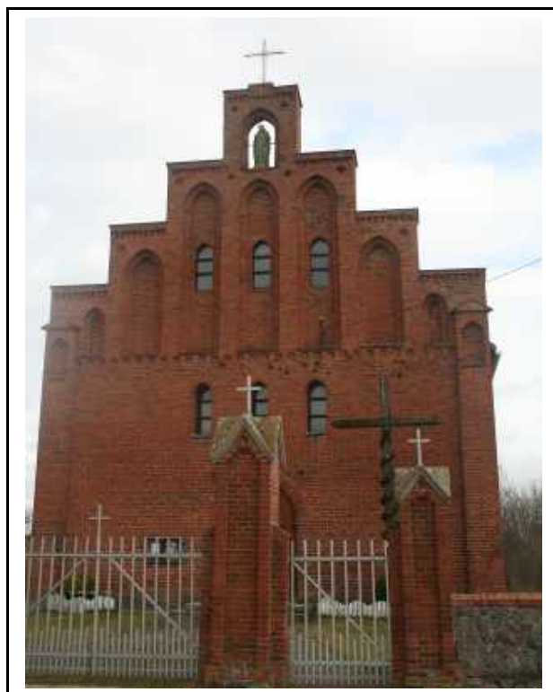
Kościół filialny p.w. Św. Jakuba Apostoła

Kościół p.w. św. Jakuba Apostoła w Leżenicy wpisany do rejestru zabytków w 2006 r. pod nr 426/Wlkp/A. Zbudowany dla tutejszych katolików w latach 1854-55. Świątynia ceglana, jednonawowa, z węższym prezbiterium zamkniętym trójbocznie, z przylegającą od strony północnej zachrystią. Nad nawą dach dwuspadowy, nad prezbiterium pięciospadowy. Wnętrze jednonawowe nakryte stropem drewnianym, otynkowanym, w prezbiterium sklepienie krzyżowe. Budowla wzniesiona w stylu neogotyckim z schodkowym szczytem z ostrołukowymi blendami i figurą św. Jakuba Apostoła w elewacji zachodniej.