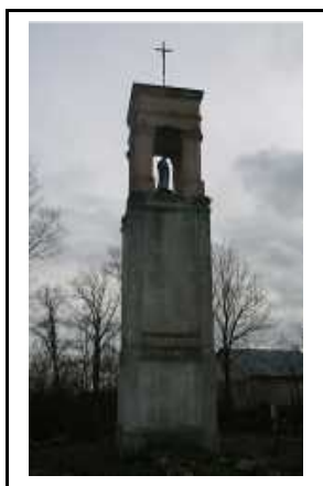
Kapliczka Matki Boskiej w Pokrzywnicy przy drodze do Szydłowa