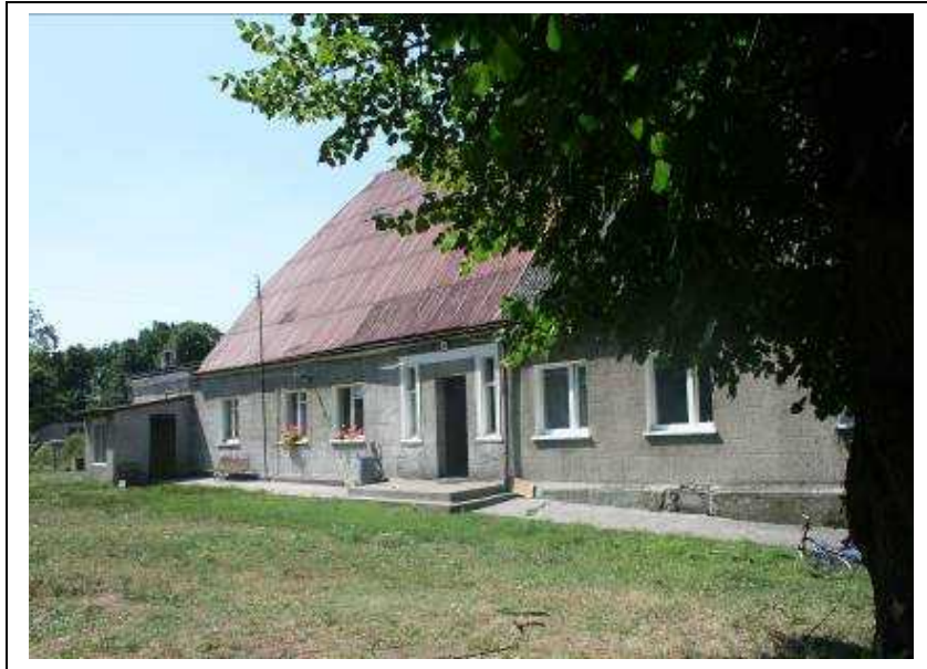
Zespół dworsko- parkowo – folwarczny w Skrzatuszu