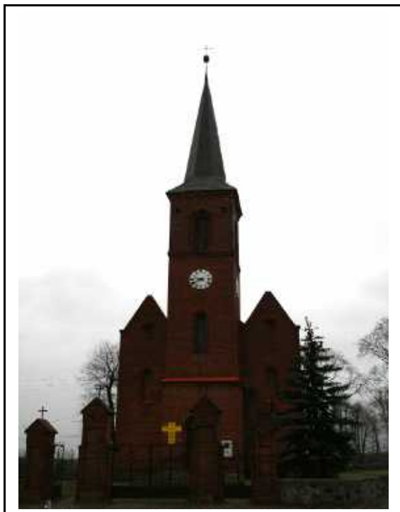
Kościół parafialny p.w. Podwyższenia Krzyża Świętego w Starej Łubiance

Obiekt wpisany do rejestru zabytków pod nr A-21/349. Niewielki, jednonawowy, z nawą pokrytą drewnianym stropem. Obecny kościół zbudowany został w 1845 r., pierwotnie konstrukcji szachulcowej, przebudowany w 1935 roku. W początkach lat 70- tych XX w. ściany szachulcowe zamieniono na murowane z cegły. Pierwotnie kościół wyznania ewangelickiego, po roku 1945 – rzymsko-katolicki.