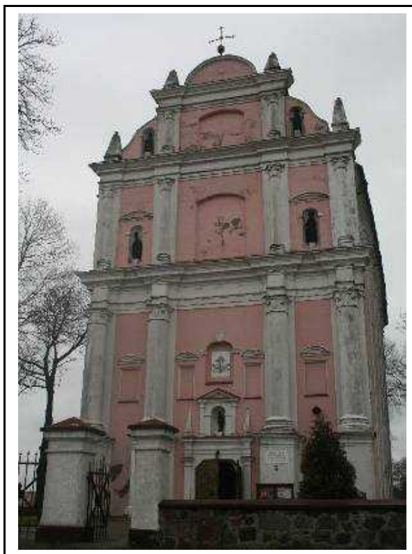
Kościół p.w. Wniebowzięcia NMP w Skrzatuszu

Najważniejszy obiekt sakralny na terenie gminy Szydłowo, wpisany do rejestru w roku 1957 pod nr.A-40/215. Kościół p.w. Wniebowzięcia NMP w Skrzatuszu, pełniący rolę sanktuarium MB Bolesnej, czczonej w wizerunku cudownej Piety, powstałej na początku XV w. Wybudowany w latach 1687-97 z fundacji Wojciecha Brezy przez architekta Bojerszę. Obiekt salowy, z prezbiterium zamkniętym trójbocznie, z zakrystią od południa, wzorowany na jezuickich budowlach sakralnych wznoszonych we Włoszech Elewacja frontowa artykułowana masywnymi kolumnami dostawionymi do ściany, między kolumnami wnęki z figurami świętych. Perła sztuki polskiego baroku, nazywana Jasną Górą Północy, postawiona jako votum dziękczynne za zwycięstwo wiedeńskie.