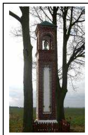
Kapliczka Matki Boskiej przy drodze Jaraczewo – Kolonia Leżenica