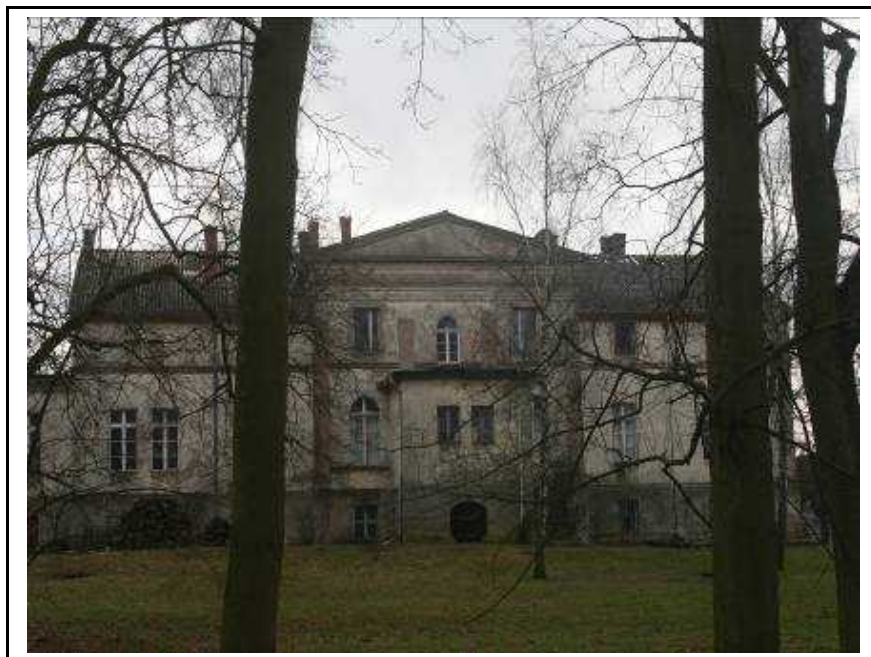
Zespół dworsko- folwarczny w Nowym Dworze

Obiekt wpisany do rejestru zabytków pod nr A-589 zbudowany na początku XX w., w stylu modernistycznym. Usytuowany na wzniesieniu w miejscowości Kotuń. Dwukondygnacyjny, murowany z cegły, całkowicie podpiwniczony. Obecnie jest własnością prywatną. Przed sprzedażą obiektu Agencja Własności Rolnej Skarbu Państwa OT w Pile w 1999 r. przeprowadziła remont elewacji, wymieniła stolarkę okienną oraz pokrycie dachowe z eternitu na dachówkę ceramiczną. Potrzebne są prace remontowe na zewnątrz i we wnętrzu obiektu.